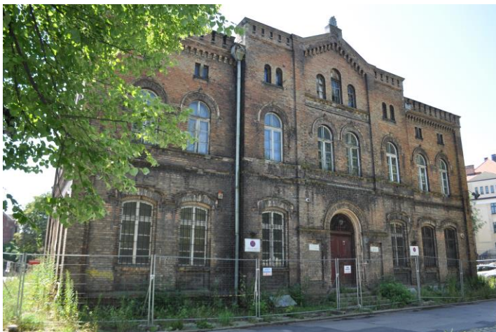
Podpis do grafiki 6.2: Dawny miejski lombard przy Placu Wałowym. Stan obecny.