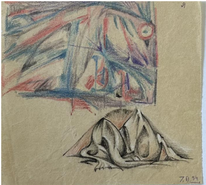
[Podpis do grafiki 4.4]:.Szkice S. Przybyszewskiej, 07.02.1934. Archiwum PAN w Warszawie, oddział w Poznaniu, sygnatura P. III – 52 A